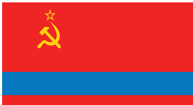
Қазақ КСР туы

Қазақстан Ресейге қосылғаннан кейін басқарудың жаңа мемлекеттік-әкімшілік жүйесі орнатылып, бұл өз кезегінде нышанның дамуына елеулі әсер етеді. Империяның бір бөлігі ретінде Қазақстанның аумағында Ресей мемлекетінің мемлекеттік нышаны пайдаланылды.