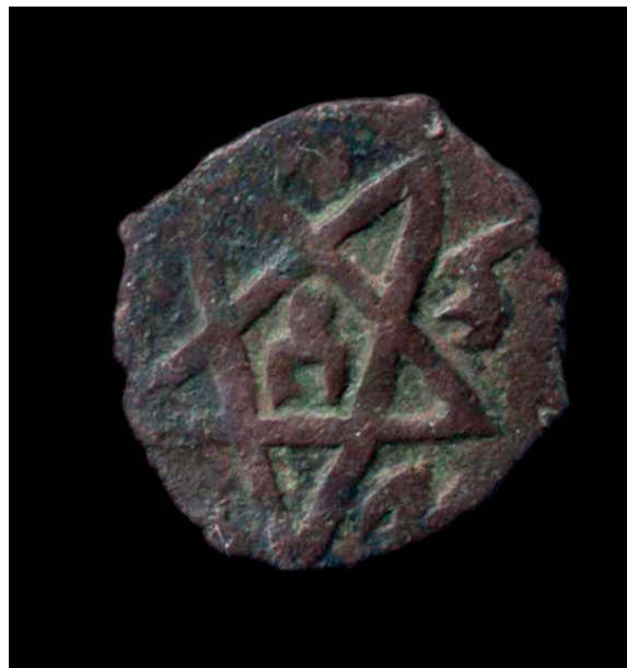
Шыңғысханның кезеңіндегі тамга

«Елтаңба» термині «ербо» немістің сөзінен шыққан. Оны аударсақ, «танба» (тамга) түсінігі қалыптасады. Бұл термин бірінші рет Түрік Қағанатында қолдана басталған (551-630 жж.).