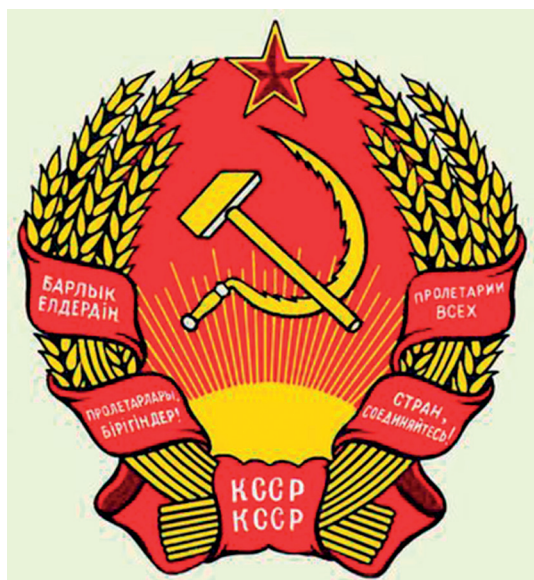
Қазақ КСР елтаңбасы

Қазақстанда басқарудың жаңа жүйесі ретке келтірілген 1867-1868 жылдардағы, сонымен қатар 1886-1891 жылдардағы әкімшілік-аумақтық реформалардың нәтижесінде ХІХ ғасырда қалалық және облыстық елтаңбалар пайда болды. Ресей империясының құрамына енген Қазақстанның барлық облыстары мен қалаларына бірңығай үлгідегі елтаңбалар тапсырылды. Ресей империясы заңдарының толық жинағында Қазақстанның облыстары мен бірқатар қалаларындағы (16 уездік және округтік қалалар) елтаңбалардың үлгілері көрсетіледі. Қазақстанда тұңғыш рет ресми түрде 1842 жылдың 7 қыркүйегінде қабылданған Петропавл қаласының елтаңбасы бекітілді.