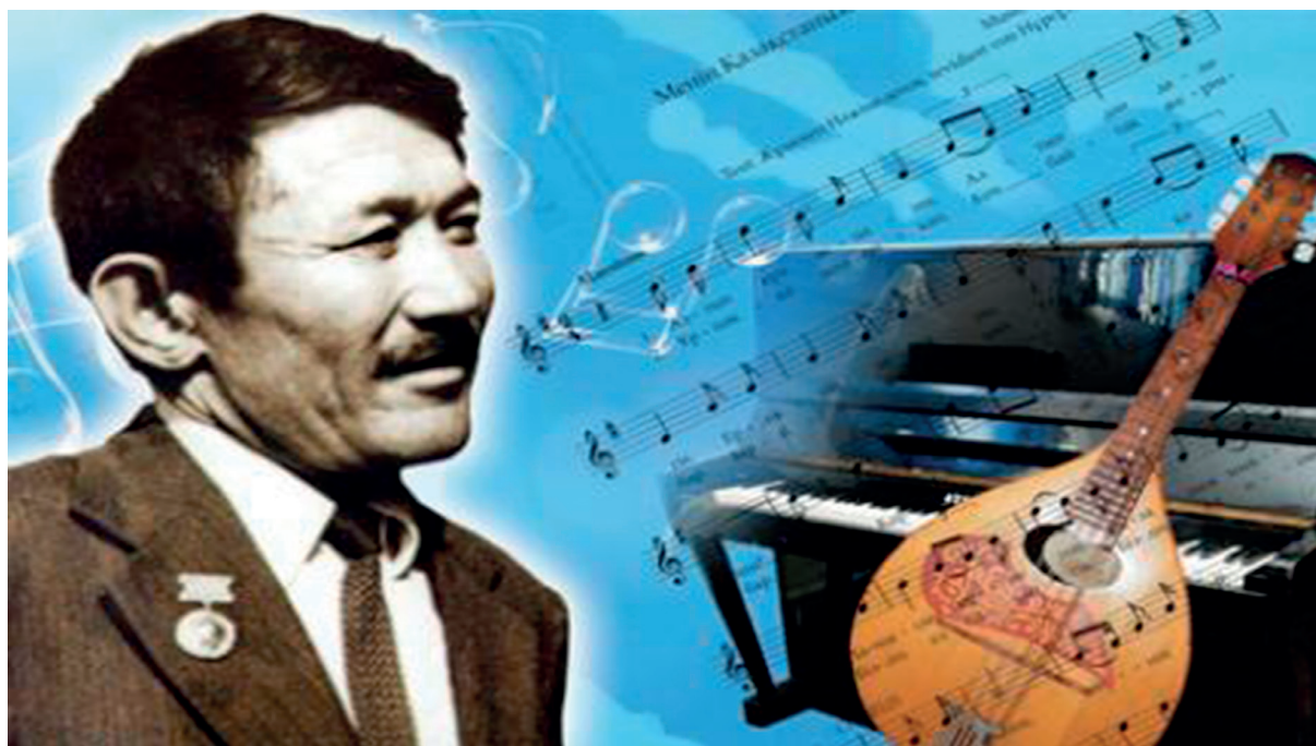
Әнұран музыкасының авторы – сазгер Шәмші Қалдаяқов

Әнді мемлекеттік әнұранның мәртебесіне сәйкестендіретін өзгерістер енгізілген «Менің Қазақстаным» 2006 жылдың 7 қаңтарында Қазақстан Республикасының әнұранына айналды.