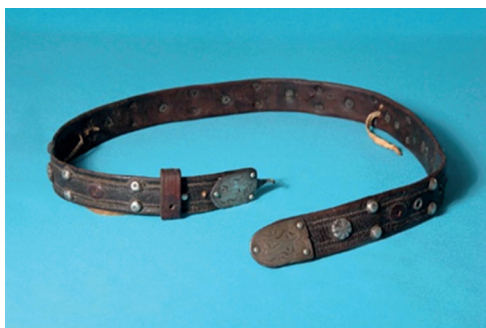
Күмісбелдік. Ерлер белдігі. XIX ғасырдың аяғы. Мөрлі, соғылма, шегемен безендірілген. Былғары, күміс. Шығыс Қазақстанның сәулеттік-этнографиялық табиғи-ландшафтық мұражай-қорығы.

Еркектер әшекейлері кию ретіне қарай: бас киім ( көзотаға – металмен көмкерілген бағалы тас, ай тәрізді тас салынған сәндік алқа – жыға ), мойын-кеуделік ( дан алқа ), арқаға, белге арналған әшекейлер (белдіктер, кейде белдікке бекітілетін гигиеналық жиынтық), қолға және аяққа арналған (теңгеден жасалған тиектүйме – теңге , күмістен – күміс , жейделерге арналған меруерттүйме , жүзік-мөрлі жүзік – балдақ , мөрлі жүзік ) болып бөлінетін.