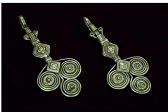
Шекелік. Самайлық әшекей. XX ғасырдың басы. Күміс. Иілме, мөр басылған, дәнекерленген. Шығыс Қазақстанның сәулеттік-этнографиялық табиғи-ландшафтық мұражай-қорығы.

Орталық және Солтүстік Қазақстанның да әшекейлері алуан түрлі. Ең көп қызығушылық тудыратын әшекейлердің бір түрі – самайлық салпыншақ-қорғауыштар – үкі аяқ, онда үкі тырнақ-