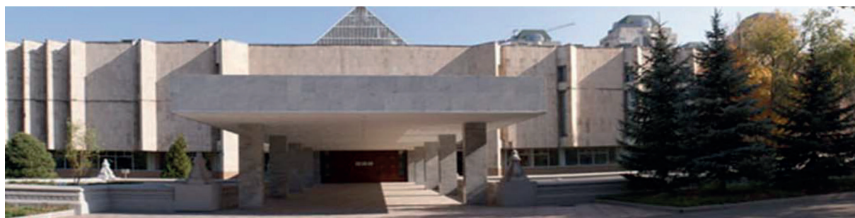
Қазақстан Республикасының Ә.Қастеев атындағы мемлекеттік өнер мұражайы.

Қазақстан Республикасының Ә. Қастеев атындағы мемлекеттік өнер мұражайында Қазақстан халқының ежелгі және қазіргі заманғы сәндік-қолданбалы өнерінің ең бір бай жиынтығы орналастырылған, экспонаттардың жалпы саны 5 мыңға жуық. Олардың 2 мыңнан астам экспонаты ХІХ-ХХ ғасырдың қазақ зергерлік өнерінің керемет үлгілері болып табылады. Көрмеге қойылған қазақы зергер бұйымдарды шартты түрде жеке-жеке Батыс, Шығыс, Солтүстік және Оңтүстік Қазақстан деп төрт өңірге бөлуге болады.