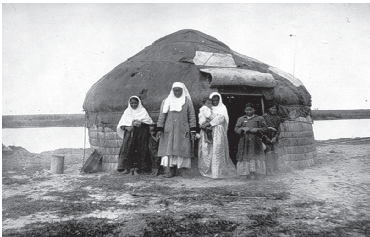
Дельта Волги. 20 августа 1926г.

Во второй половине XVIII в. военный строитель, капитан И.Г.Андреев писал: «основная отрасль рукодельного искусства казахов – изготовление юрт». Член Российской и Римской Академий, член Королевского английского научного собрания П.С.Паллас в 1766 и 1769 гг. посетил Западный Казахстан и писал о быте и жизни казахов, переселявшихся на восточное побережье Урала: «казахи живут в юртах, в них свободно помещается до 20-ти человек».